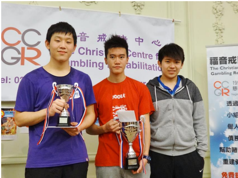
去年11月「向賭說不」青年乒乓球錦標賽冠亞季軍得獎者

今年中心已踏入十八週年，感謝主，在一群忠心的領袖、義工朋輩關顧者的同行下，今日的戒賭中心能成為許多賭徒和家人在其中經歷修補和重建生命的地方。